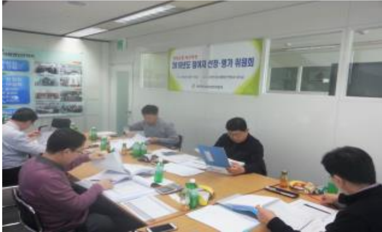
참여자 선정평가위원회 평가