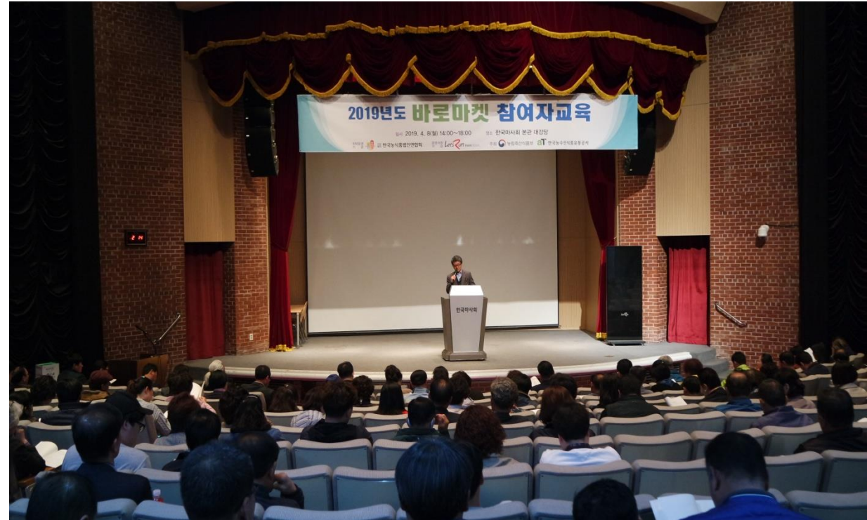
선정 참여자 교육 및 설명회