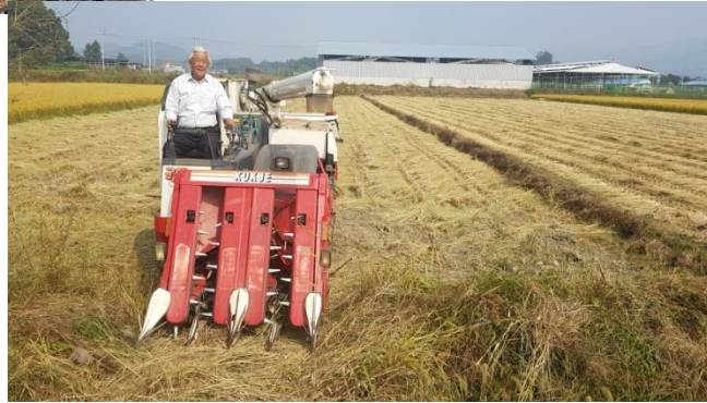
입점 농가 현장조사