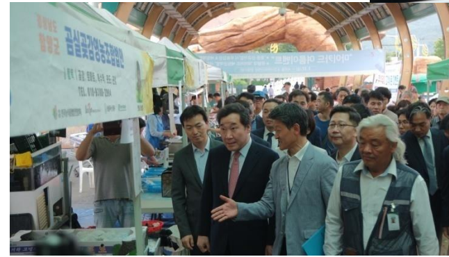
이낙연 국무총리 장터 방문